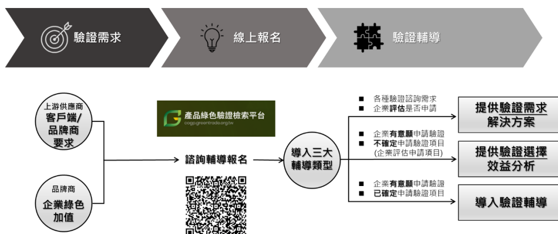
圖 2 國際綠色驗證輔導流程

凡欲報名國際綠色驗證輔導之企業，可直接於「產品綠色驗證檢索平台」線上填寫企業基本資料，審查後依企業國際綠色驗證之需求，協助導入國際綠色驗證輔導，輔導內容包括協助提供驗證需求之解決方案、提供驗證選擇之效益分析或協助導入驗證輔導以申請國際綠色驗證（輔導流程如圖2所示）。